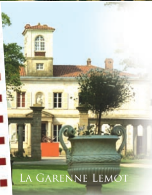
LA GARENNE LEMOT