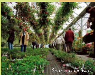
Serre aux fuchsias

20000 m 2 de serre de culture pour découvrir 700 variétés de fuchsias, ainsi que des plantes rares et curieuses. Tél. : 02 40 31 93 05