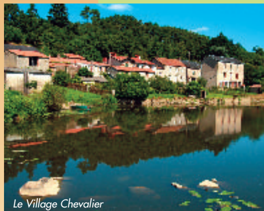
Le Village Chevalier

C'est une grande promenade qui nous entraîne sur les chemins agricoles et les petites routes tranquilles de campagne. Du départ, le circuit rejoint très vite la Sèvre et remonte aussitôt dans le bocage. Dernière ligne droite à travers champs et sous-bois sur l'ancienne route de Nantes à Poitiers, puis un sentier nous emmène sur les rives