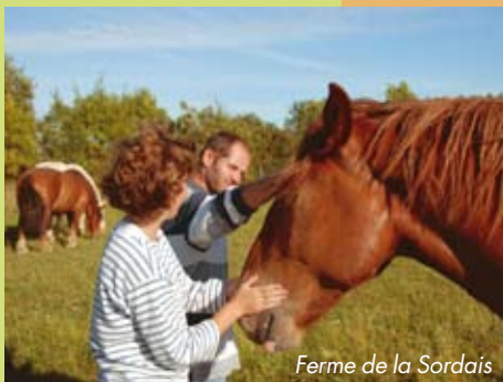
Ferme de la Sordais

Cité historique au caractère unique où la tuile et la brique se mêlent à l'ardoise et au granit. Le château domine la Sèvre Nantaise du haut d'un éperon rocheux depuis le XI e siècle. Le dédale de ruelles et le Parc de la Garenne Lemot forment un véritable décor aux couleurs d'Italie. 3 parcours, "Fenêtres... sur l'Italie", "Seigneurs et Dames" et "Ruine romantique" pour découvrir la ville et ses trésors cachés.