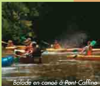
Balade en canoë à Pont-Caffino

Cité historique au caractère unique où la tuile et la brique se mêlent à l'ardoise et au granit. Le château domine la Sèvre Nantaise du haut d'un éperon rocheux depuis le XI e siècle. Le dédale de ruelles et le Parc de la Garenne Lemot forment un véritable décor aux couleurs d'Italie. 3 parcours, «Fenêtres... sur l'Italie», «Seigneurs et Dames» et «Ruine romantique» pour découvrir la ville et ses trésors cachés. Rens. à l'Office de Tourisme.